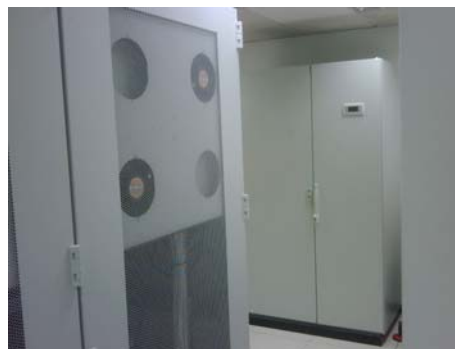
Fig 2. Vista del CRAC