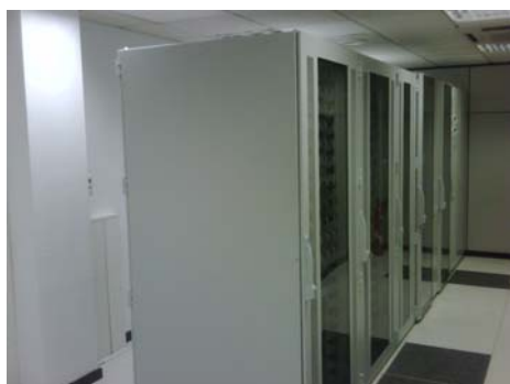
Fig 1. Vista de rack y LCP